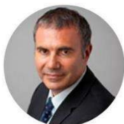
PIERRE PELOUZET Médiateur des entreprises