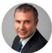
PIERRE PELOUZET Médiateur des entreprises