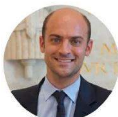
JEAN-NOËL BARROT Vice-Président de la commission des Finances à l'Assemblée nationale