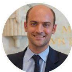
JEAN-NOËL BARROT Vice-Président de la commission des Finances à l'Assemblée nationale